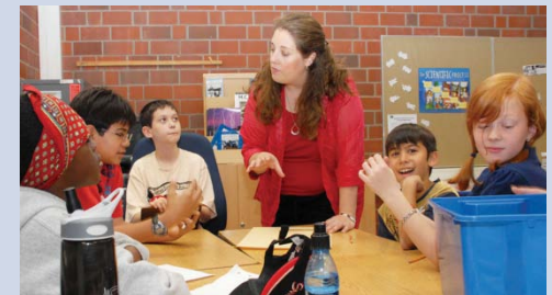
Imagen por gentileza del U.S. Army , Susan Huseman (http://www.army.mil/-images/2009/07/06/43908/) Made available under public domain