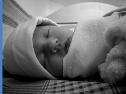
Imagen por gentileza de rudecatus.com (http://www.rudecactus.com/2005/08/) Made available under CC BY-NC-SA 2.0